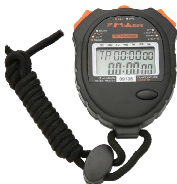
Cronômetro (Anexo 1, Fig. 01)