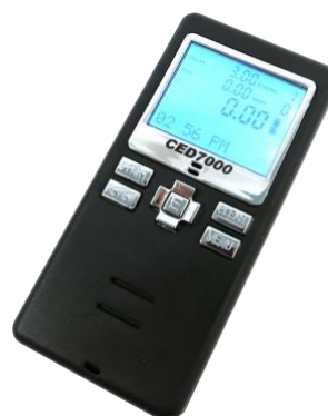
Shot Timer (Anexo 1, Fig. 02)