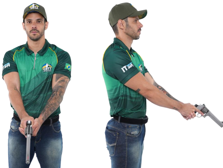
Posição Inicial (Anexo 1, Fig. 05)