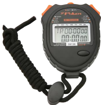
Cronômetro (Anexo 1, Fig. 01)