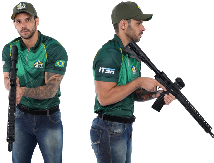
Posição Inicial de Arma Longa (Anexo 1, Fig. 05)